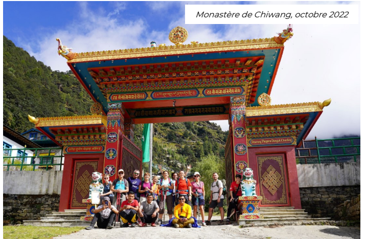
Monastère de Chiwang, octobre 2022