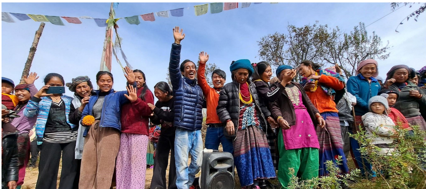
Les lapchalis, octobre 2023