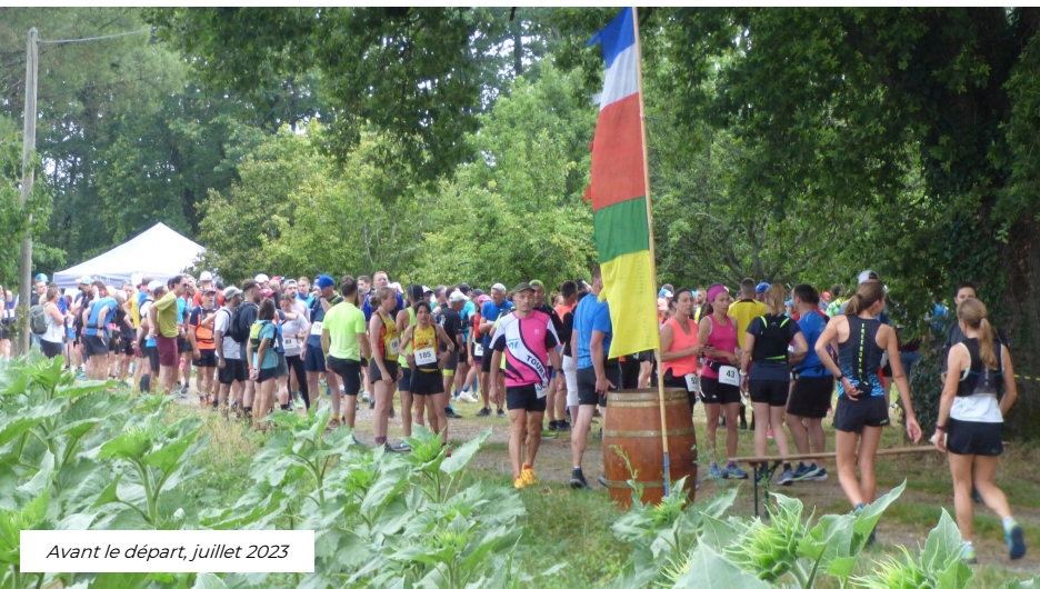
Avant le départ, juillet 2023