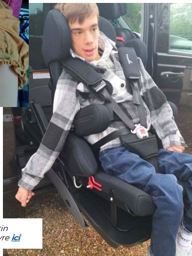
Le grand Quentin Son actualité à suivre ici