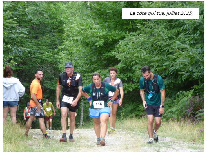
La côte qui tue, juillet 2023