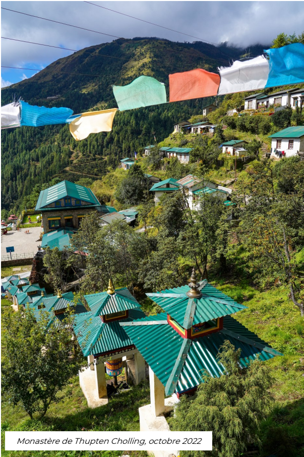
Monastère de Thupten Cholling, octobre 2022