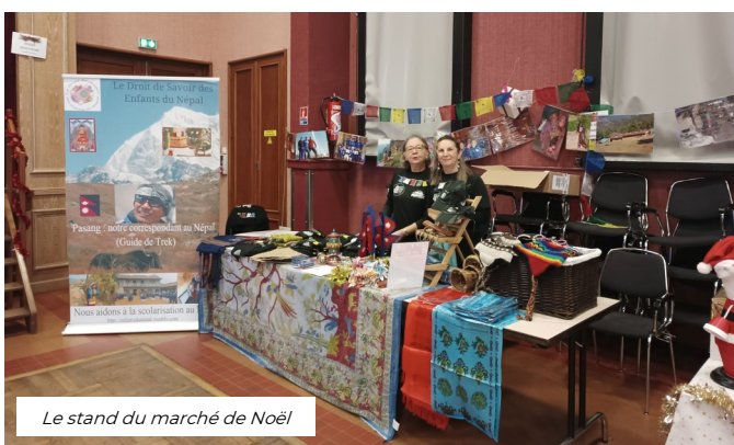
Le stand du marché de Noël