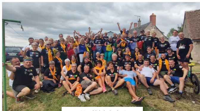
Merci à bénévoles !

DIM 14 JUILLET 2024 Trail pour les Enfants du Népal, 12ème édition au Domaine de la Marinière à Panzoult