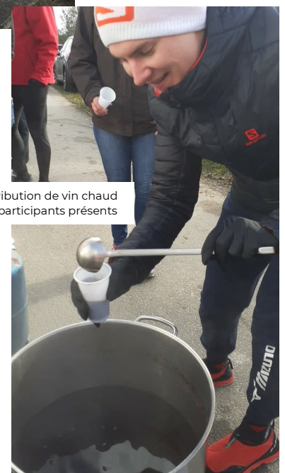
Distribution de vin chaud aux participants présents