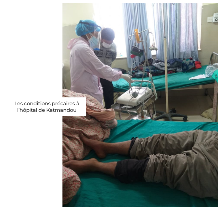
Les conditions précaires à l'hôpital de Katmandou