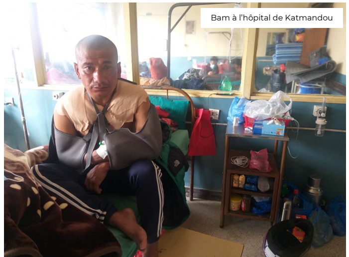
Bam à l'hôpital de Katmandou