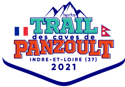
Logo du Trail des Caves de Panzoult 2021