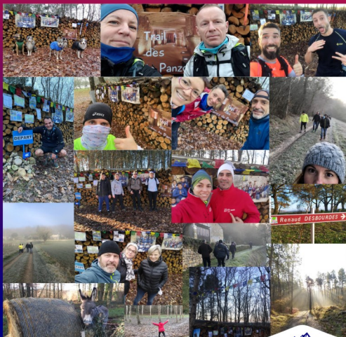
Dons récoltés durant l'événement

Pour faire un don : enfantsdunepal.weebly.com