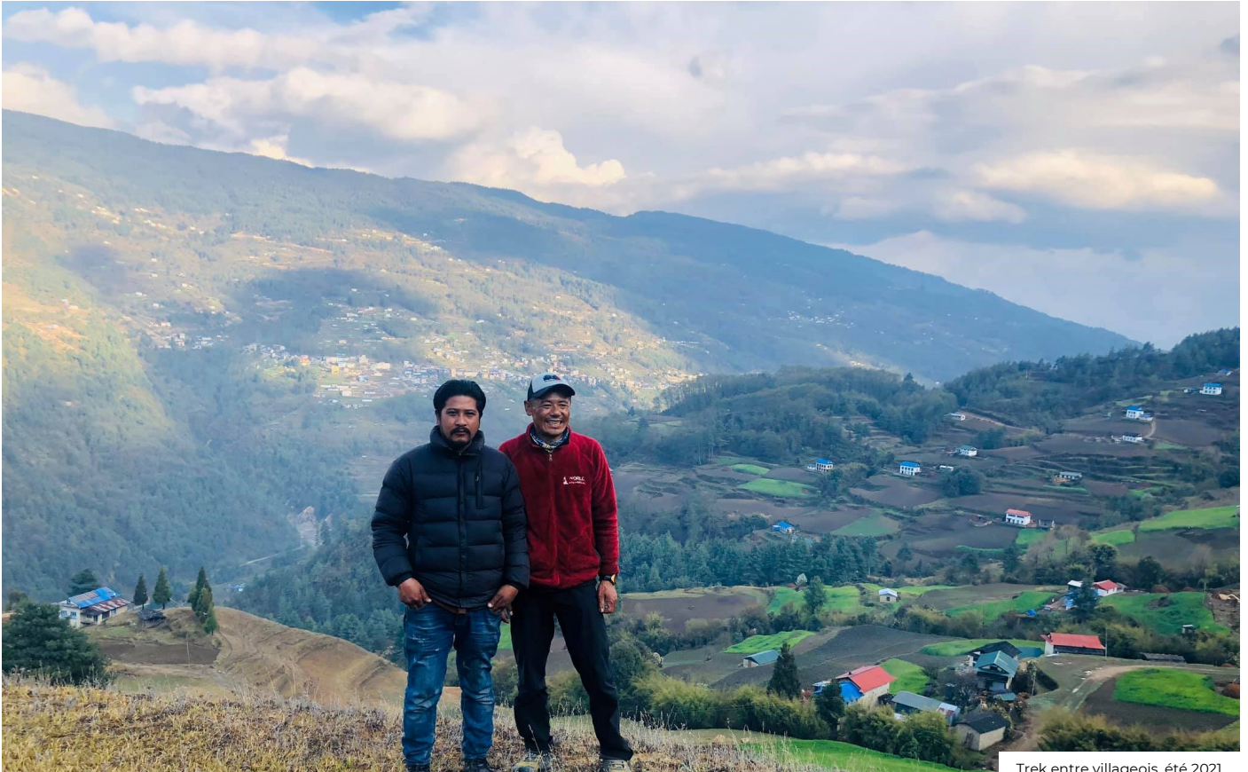
Trek entre villageois, été 2021